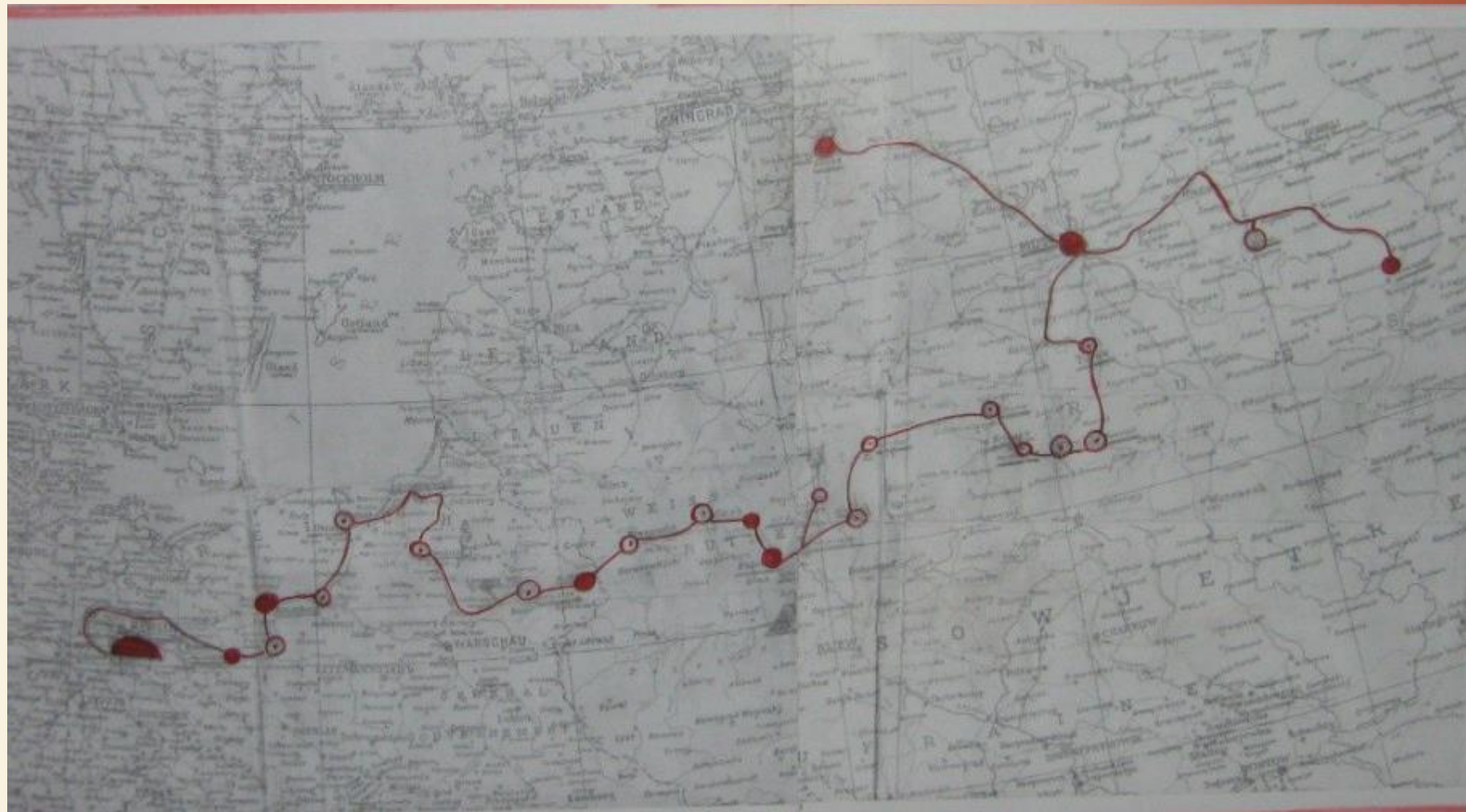
Схема боевого пути Качурина А.А., отмеченного Качуриным А.А. на немецкой карте