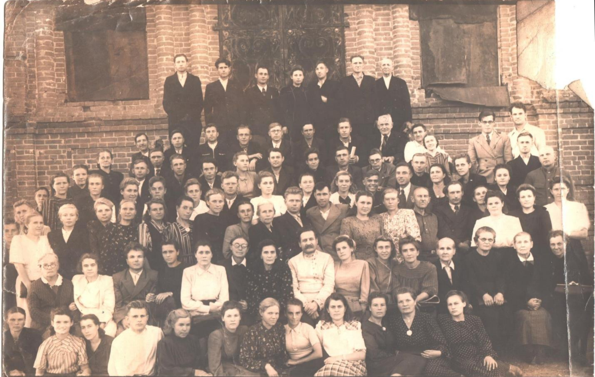
19 \frac{26}{VIII} 51 Село. ЛОСОП Саранского р-на МССР Учительская Коммерция.