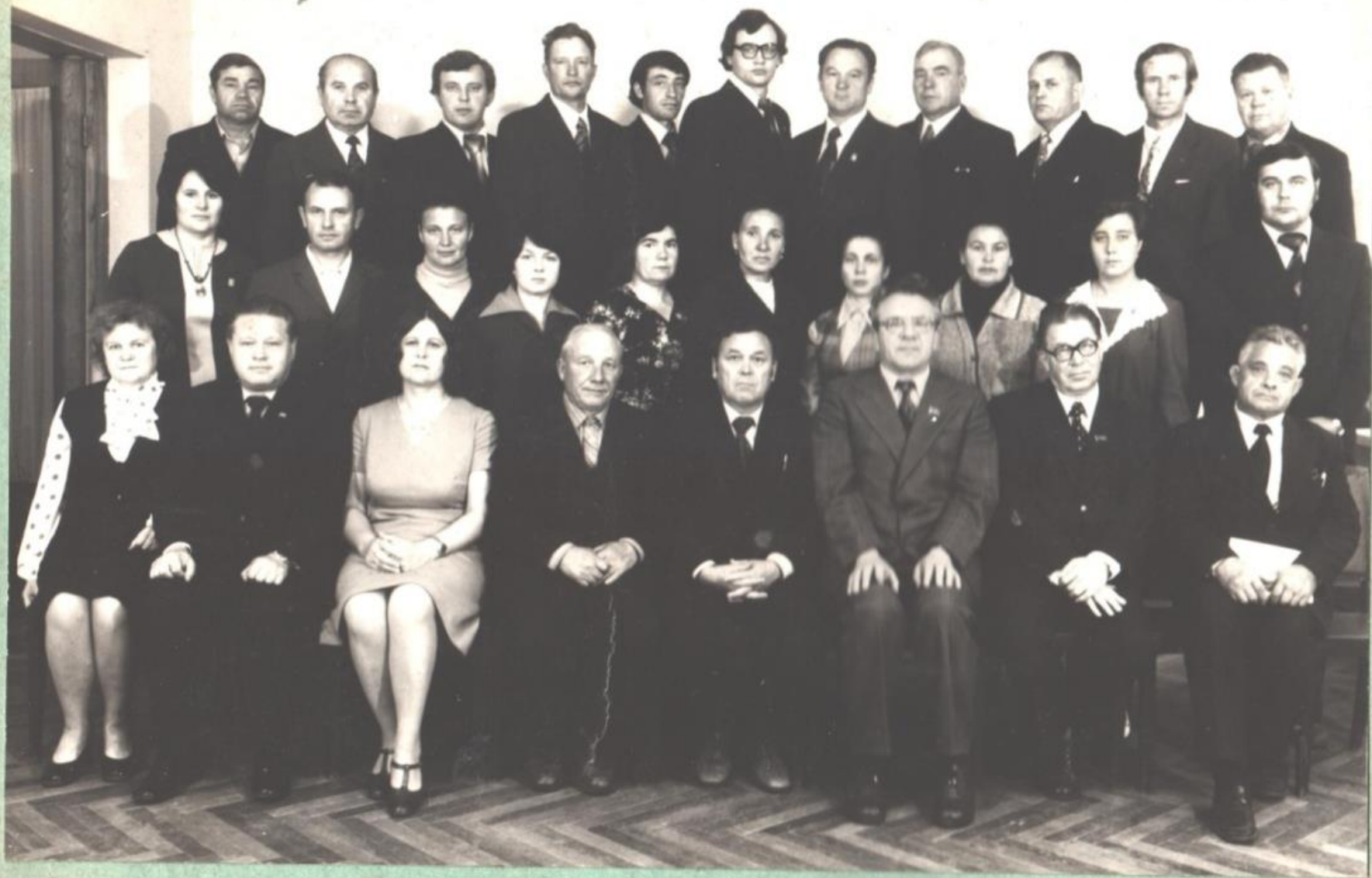
Встреча с лучшими пропагандистами республики г. Саранск 1980 год.